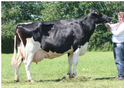
Annelund Rudolph Roxette

Dec 2007 var medelpoäng för Kropp 83,3 , juver 81,0 , ben 80,7 och för helhet 81,6 För det mesta finns livdjur, tjurar och embryon till salu.