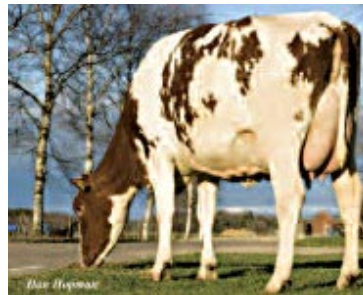
Stäme Faber Maud- Red VG87